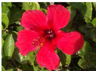
Hibiscus sur le campus universitaire de la FSJES de Casablanca